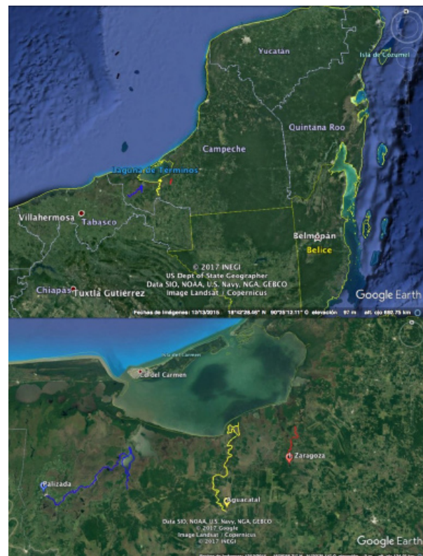
Figura 1. Ubicación del área del Área de Protección de Flora y Fauna Laguna de Términos en el Estado de Campeche. Sitios de muestreo; azul= río Palizada, comunidad Palizada; amarillo= río Chumpán, comunidad Aguacatal y rojo= río Candelaria; comunidad I. Zaragoza.

Los muestreos se realizaron en los ríos Palizada de 76 km, Chumpán de 63 km y Candelaria de 16 km, de los meses octubre a diciembre de 2016 con una visita mensual a cada sitio. Por motivos logísticos únicamente se realizaron recorridos en los cauces principales, por lo que no se tomaron en cuenta lagunas, jagüeyes y arroyos tributarios. Para realizar el conteo de