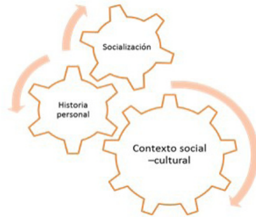
Figura 1. Componentes de la emoción

Hasta aquí hemos expuesto que las emociones y sus expresiones son construidas y moldeadas socialmente, que para su entendimiento no bastan las razones biológicas y las intenciones de su naturalización que han hecho algunas disciplinas científicas, sino que es imprescindible tomar en cuenta las relaciones sociales para un mayor conocimiento de las mismas.