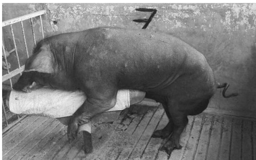
Figura 3. Macho Cerdo Pelón previo a la colecta seminal.